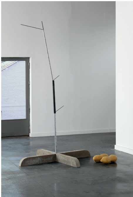
Payday, 2013 Holz, Metall, Lack, Beton