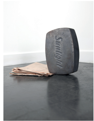
Pink news - massive sunlight, 2013 Gusseisen und Finanz-Zeitungen