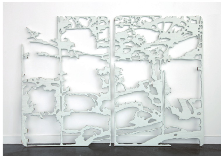
Little less china, 2013 Holz, Lack

Dauer der Ausstellung: 26.10. – 06.12.2013